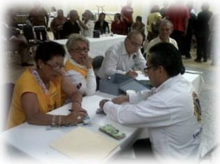
Registro de Asistentes