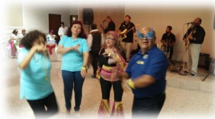
Noche de Baile y Diversión