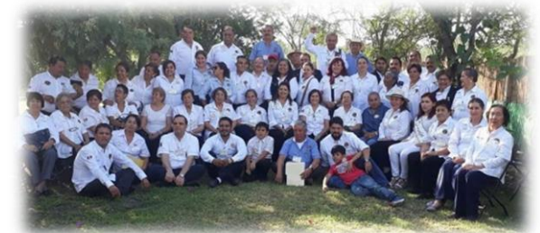
Comida de Despedida