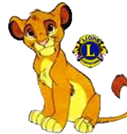
Junta de Cachorros