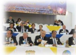
Junta de Coordinadoras Comité de Damas