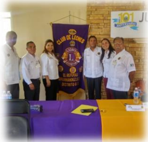
Reunión de Damas del Gabinete