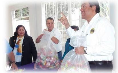
Continúan Trabajos "3ª. Junta de Gabinete"